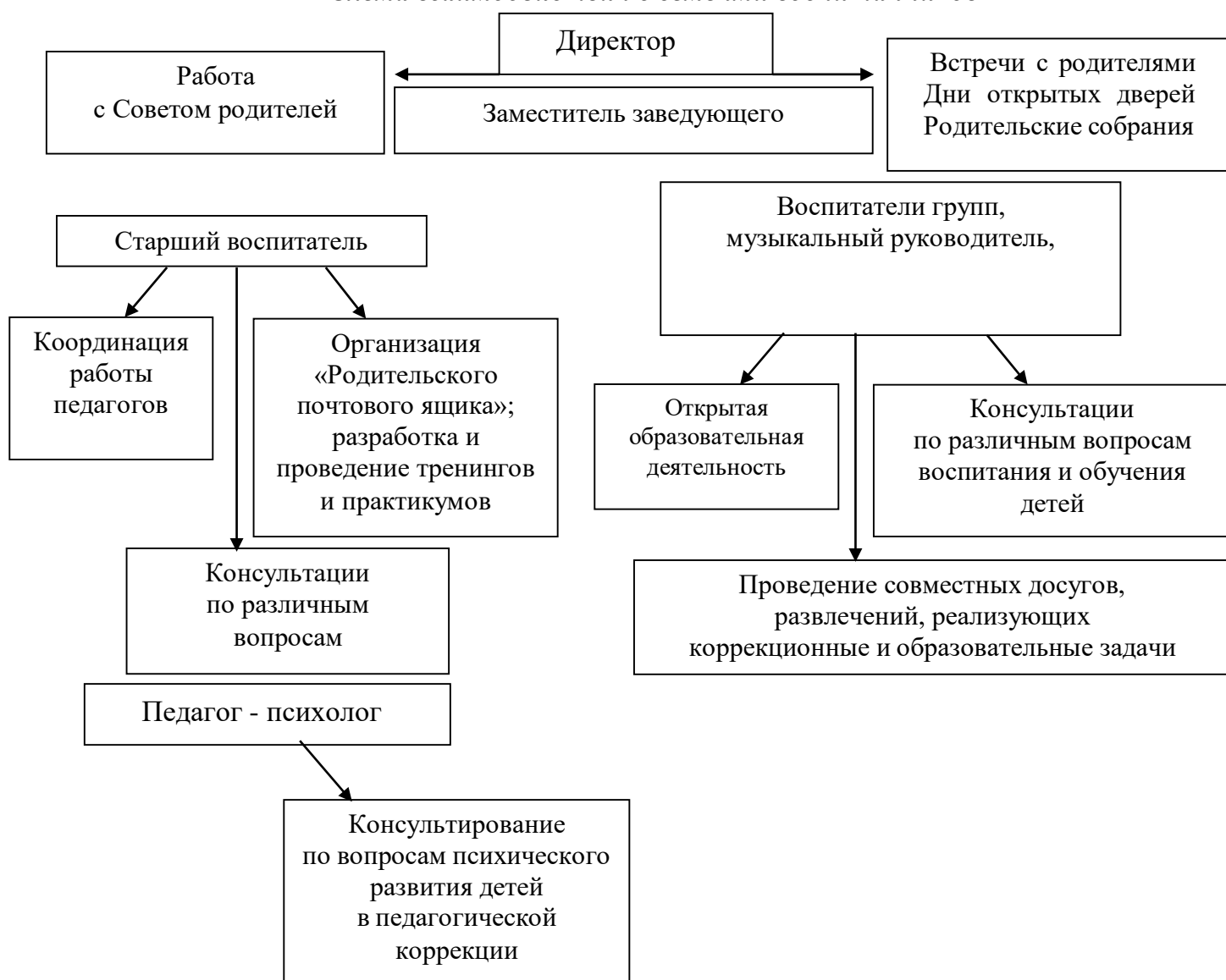
Схема взаимодействия с семьями воспитанников